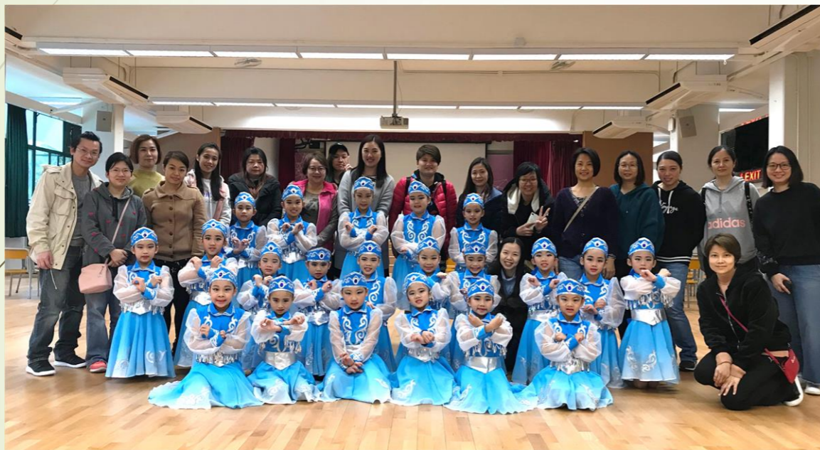
校際舞蹈節比賽初級組(2019年1月)