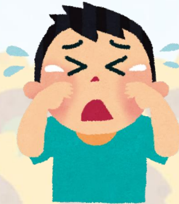
因在學校時間長， 會掛念家人